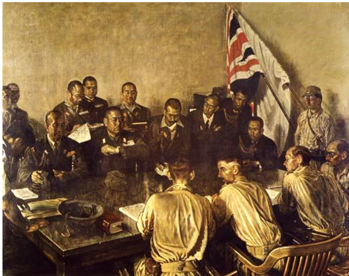
宮本三郎 1942年 油彩 東京国立近代美術館蔵(無期限貸与)