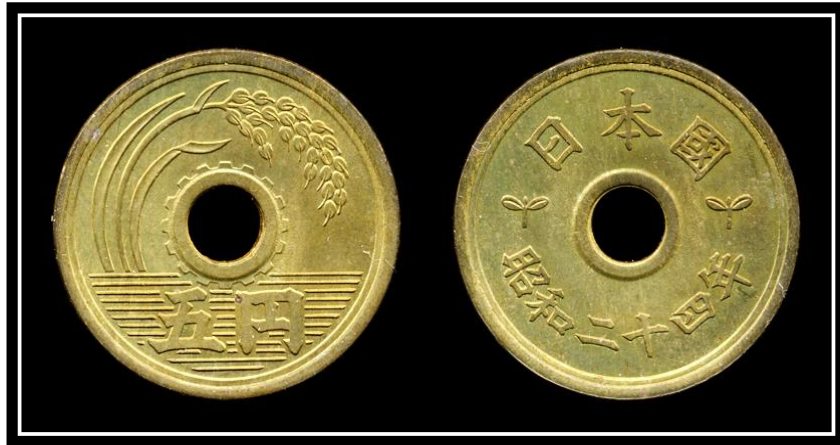
直径22mm 量目3.75g(尺貫法の1匁に当たる)